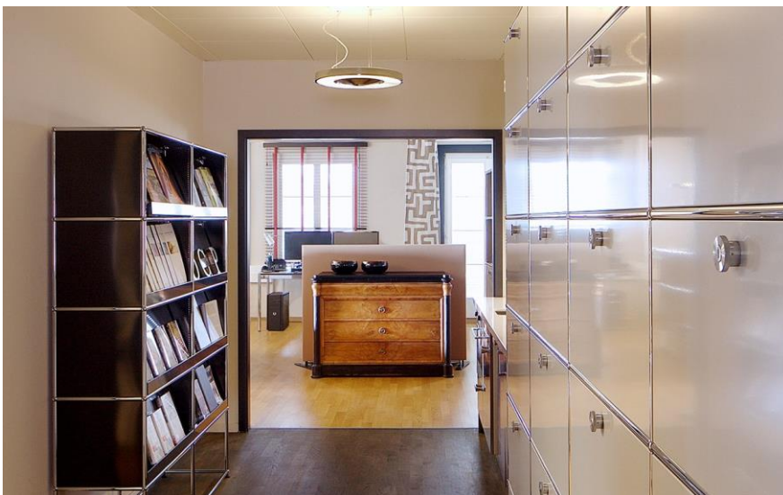
Vintage-Möbel setzen in der modernen Bürolandschaft gemütliche Akzente.